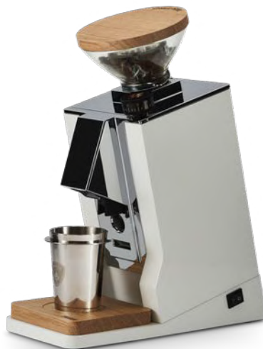
Bianco & Rovere · White & Oak