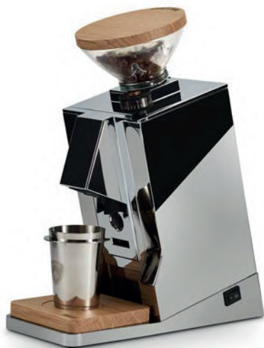
Cromato & Rovere · Chrome & Oak