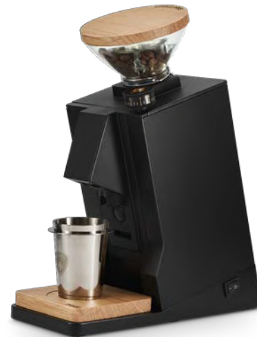
Nero Opaco & Rovere · Matt Black & Oak